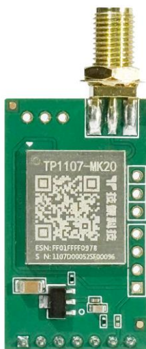
图 1 模组俯视图