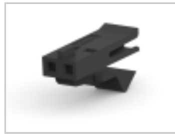
002 HOUSING FFC RCPT 100CL SR