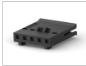
005 HOUSING FFC RCPT 100CL SR