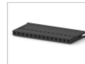
014 HOUSING FFC RCPT 100CL SR