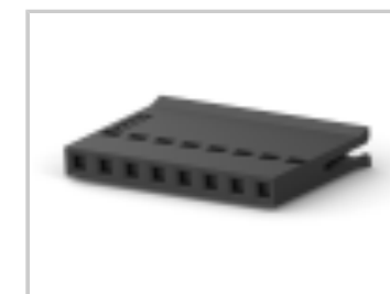
008 HOUSING FFC RCPT 100CL SR