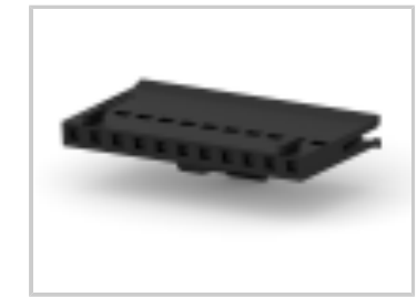
011 HOUSING FFC RCPT 100CL SR