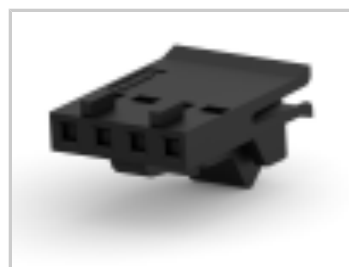
004 HOUSING FFC RCPT 100CL SR