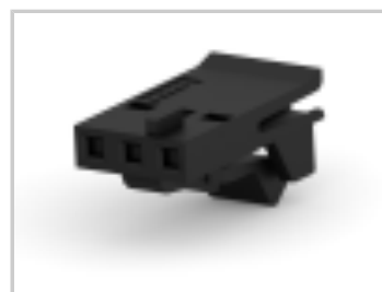
003 HOUSING FFC RCPT 100CL SR