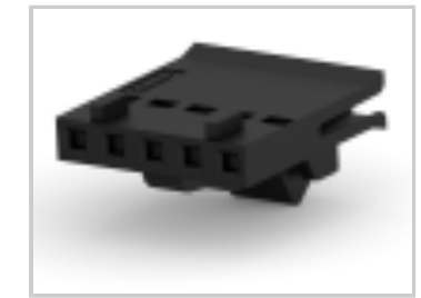
005 HOUSING FFC RCPT 100CL SR