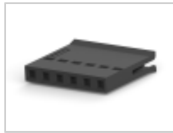
006 HOUSING FFC RCPT 100CL SR