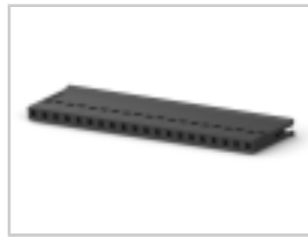
020 HOUSING FFC RCPT 100CL SR