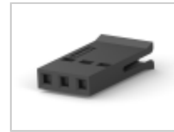
003 HOUSING FFC RCPT 100CL SR