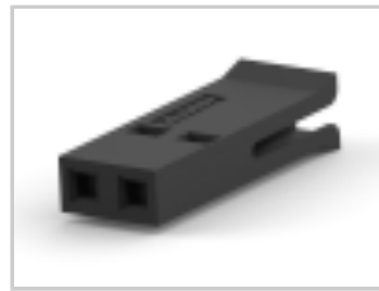
002 HOUSING FFC RCPT 100CL SR