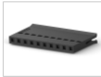
010 HOUSING FFC RCPT 100CL SR