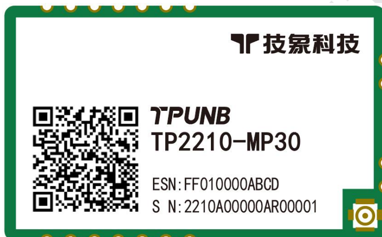
图 1 模组俯视图