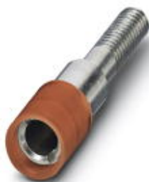
测试孔式连接器，颜色: 红色

Please be informed that the data shown in this PDF Document is generated from our Online Catalog. Please find the complete data in the user's documentation. Our General Terms of Use for Downloads are valid ( http://download.phoenixcontact.com )