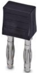
短路连接器，针距: 10 mm，位数: 2，颜色: 黑色

Please be informed that the data shown in this PDF Document is generated from our Online Catalog. Please find the complete data in the user's documentation. Our General Terms of Use for Downloads are valid ( http://download.phoenixcontact.com )