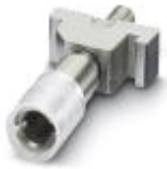
测试孔式连接器，颜色: 绿色