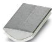
棱柱补偿块，颜色: 银色