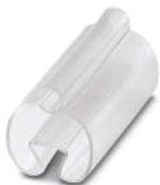
导线标记条支架，透明，未标记，安装方式: 滑块，电缆直径范围: 10 - 14 mm，标识区域大小: 30 x 4 mm

Please be informed that the data shown in this PDF Document is generated from our Online Catalog. Please find the complete data in the user's documentation. Our General Terms of Use for Downloads are valid ( http://download.phoenixcontact.com )