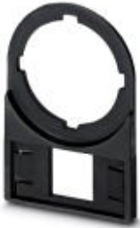
标记槽，黑色，未标记，安装方式: 螺钉，铆钉，直径: 22 mm，标识区域大小: 27 x 12.5 mm

Please be informed that the data shown in this PDF Document is generated from our Online Catalog. Please find the complete data in the user's documentation. Our General Terms of Use for Downloads are valid ( http://download.phoenixcontact.com )