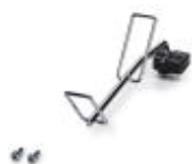
备件旋转臂，用于压接设备CF 3000-2,5

附件 - CF 3000 SCHWENKARM KOMPL. - 3202766