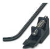
备件对中叉（顶部），用于压接设备CF 3000-2,5

附件 - CF 3000 ZENTRIERGABEL OBEN - 3202740