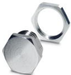
M16旋入式保护盖，用于保护未使用的M12外壳开口

Please be informed that the data shown in this PDF Document is generated from our Online Catalog. Please find the complete data in the user's documentation. Our General Terms of Use for Downloads are valid ( http://download.phoenixcontact.com )